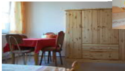
Das zweite Schlafzimmer ...

Die geräumige, hell und modern eingerichtete Ferienwohnung liegt im Dachgeschoss unseres Hauses in erholsamer und von entspannender Natur umgebener Ruhe und bietet Ihnen eine Wohnfläche von 92 Quadratmetern. Diese teilen sich in Wohnraum mit Balkon, Diele, 2 Schlafzimmer, Küche, Bad (mit Dusche und Einbauwanne) sowie Gäste-WC auf. Die Ferienwohnung verfügt über einen separaten Eingang, vor welchem sich unmittelbar der Stellplatz für Ihr Fahrzeug befindet.