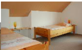
... ist mit zwei Einzelbetten ausgestattet.