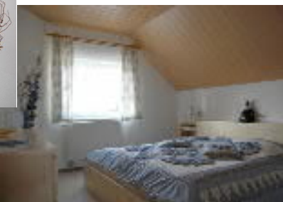
.....komfortablem Doppelbett sowie einer begehbaren Ankleide.