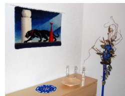
Das Hauptschlafzimmer mit...